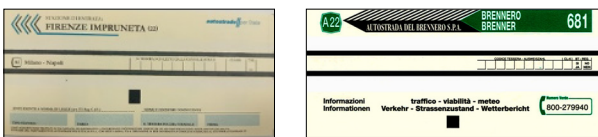
Įvažiavimo į „Autostrade per l'Italia“ ir „Brennero“ bilietų pavyzdžiai

a) Jei įmanoma, kiekvienoje dvimodalėje juostoje atspausdinamas bilietas, kad pakiltų užtvaras. Saugokite jį kelionės metu ir išvažiavimo punkte įdėkite į dvimodalės juostos aparatą.