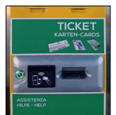
Bilietų automatas Brennerio greitkelyje

a) Jei bilietas buvo atspausdintas įvažiavimo punkte, išvažiavimo juostoje reikia naudoti dvimodalę juostą. Čia bilietas įkišamas į aparatą, kad būtų galima deklaruoti įvažiavimą. Atpažinus OBU, kelionė baigiama ir užtvaras pakyla.