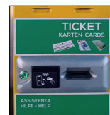
Automat na lístky na Brennerské dálnici

a) Pokud byl na vjezdu vytažen lístek, musí být při výjezdu použit bimodální jízdní pruh. Zde se lístek vkládá do automatů, aby se doložil vjezd. Je-li OBU rozpoznána, je jízda ukončena a závora se zdvihne.