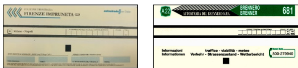
Příklady lístků na vjezdech na Autostrade per l'Italia und Brennero

a) Pokud je to možné, vytahuje se na každém bimodálním jízdním pruhu lístek, aby se závora zdvihla. Lístek si po dobu jízdy uložte a použijte ho v bimodálním jízdním pruhu na výjezdu.