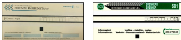
Exemples de billets d'entrée à l'Autostrade per l'Italia et au Brennero

a) le cas échéant, dans chaque voie bimodale, un ticket sera fourni pour lever la barrière, veuillez conserver pendant le trajet et l'utiliser dans une voie bimodale à la gare de sortie.