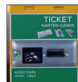
Distributeur de tickets au Brenner

a) si un ticket a été pris à la gare d'entrée, la voie bimodale doit être empruntée à la gare de sortie, afin de pouvoir insérer le ticket pour justifier votre entrée sur l'autoroute. Si le boîtier est détecté, le trajet s'achève et la barrière se lève.