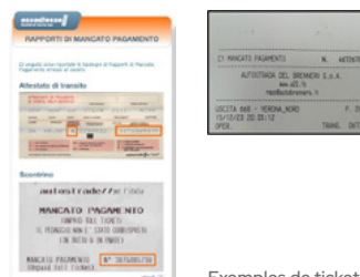
Exemples de ticket d'entrée à l'Autostrade per l'Italia et au Brenner

NB : en cas de non-paiement du péage, le perceuteur de péage entamera une procédure de recouvrement