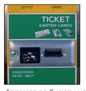
Автомат за билети на Бренер