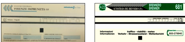
Примери за входни билети за автомагистралата в Италия и Бренер